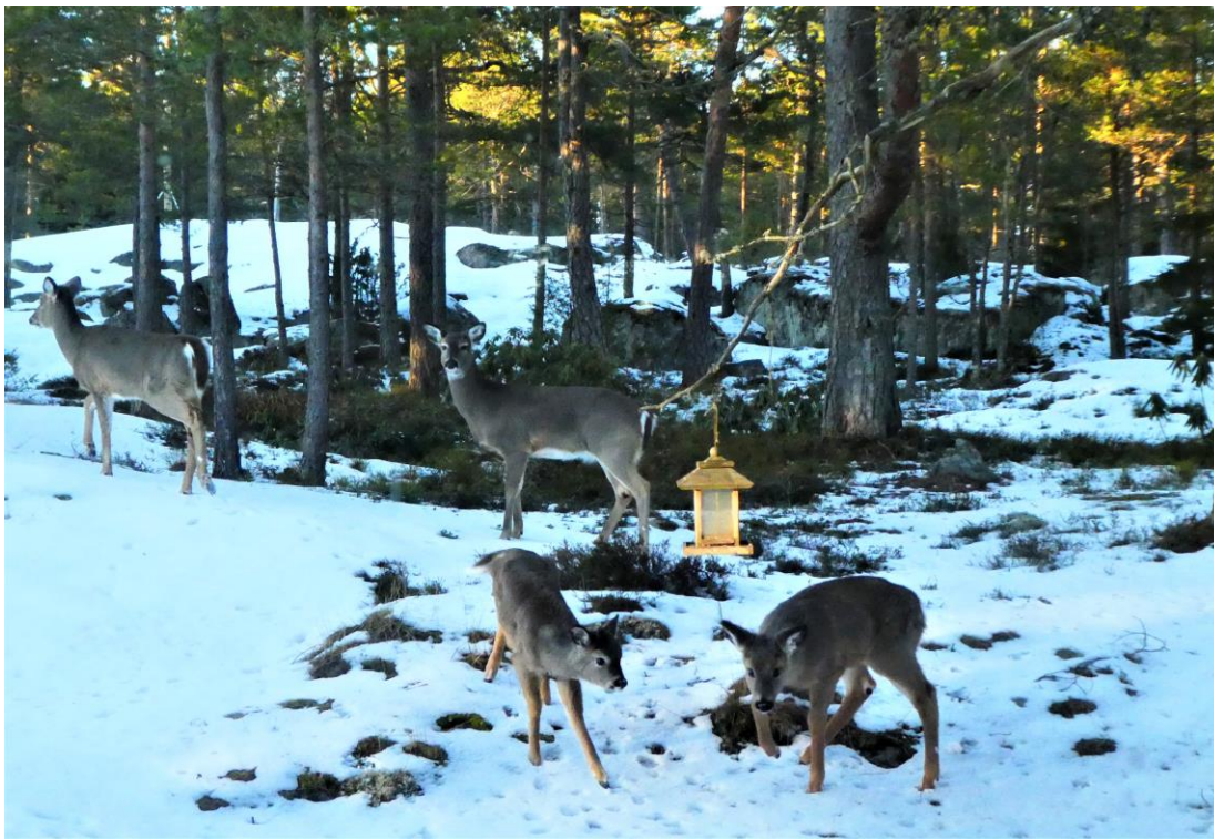
18.3 kom helä släkten vitsvanshjort till vår fågelmatning. 4 vuxna och 3 fjolårskalvar.