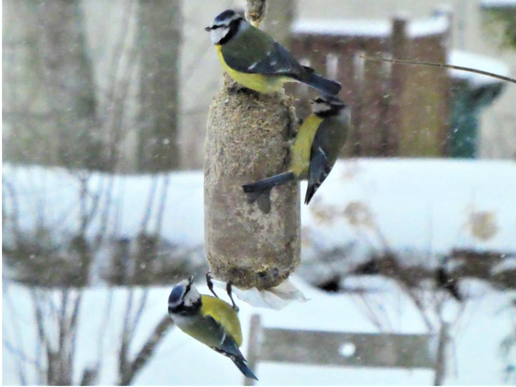
9.3 var det livligt på gårdarna i Grankulla.