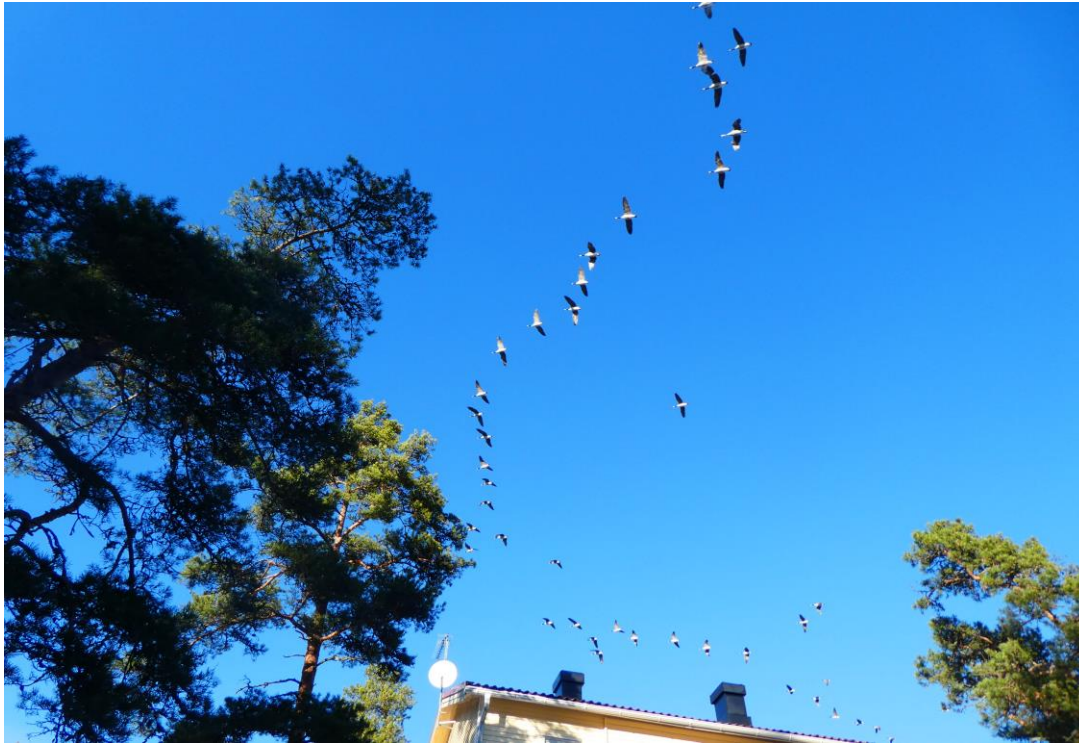
18.3 kom vårens första gässplogar över vårt hus i Porkala. C. 60 kanadagäss.