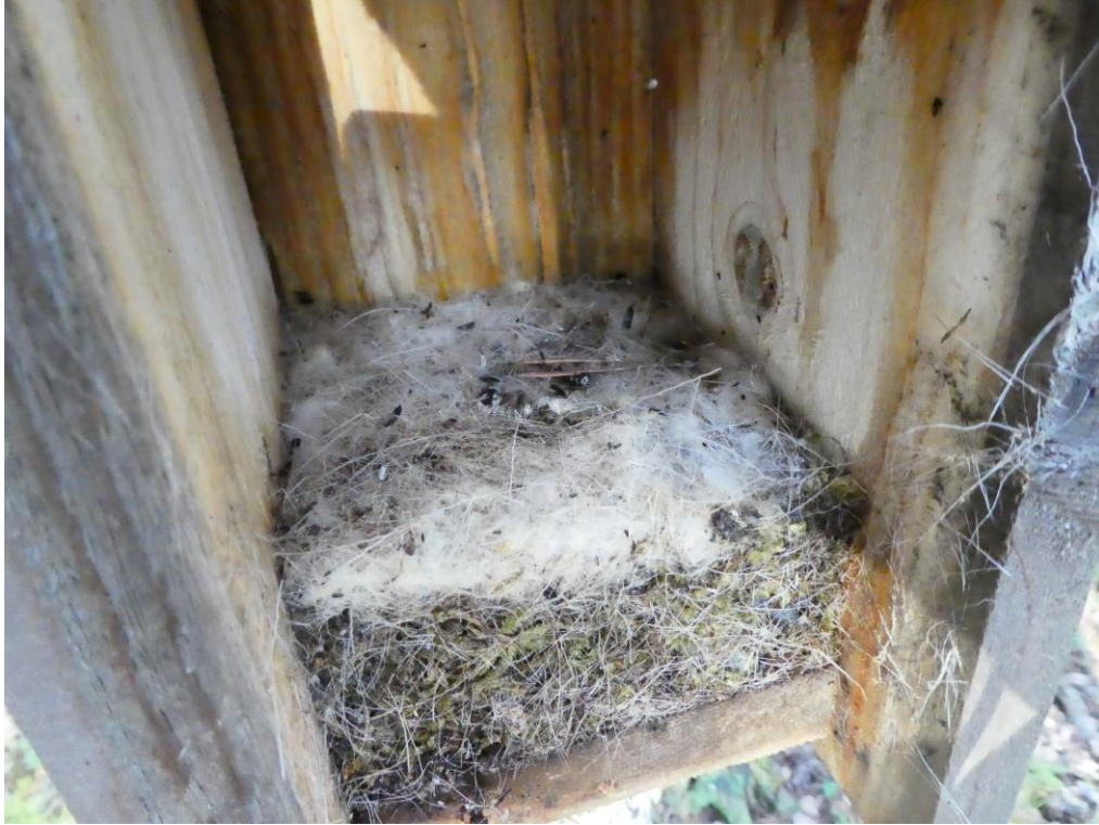
Holkarna i skärgården tömdes och så här mjukt kan ett talgoxebo vara.