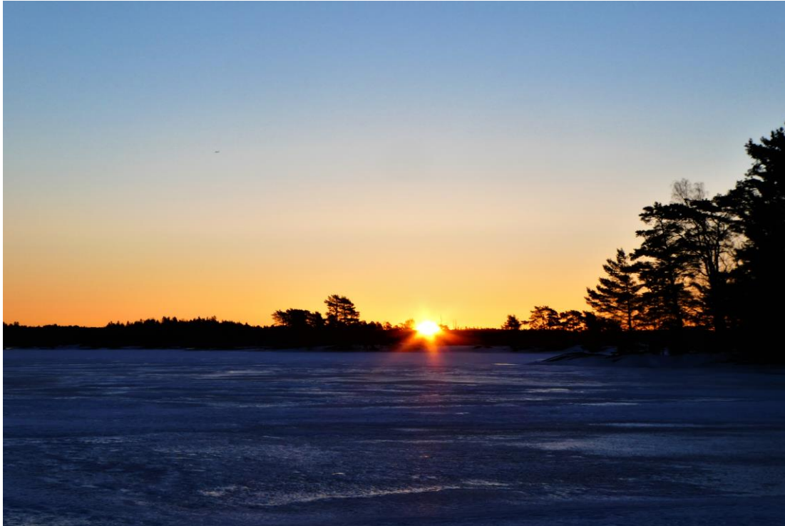
Om man ger sig ut litet över 6 på morgonen, får man se solen gå upp.