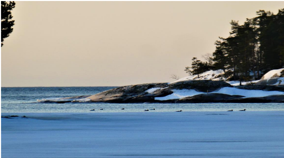
24.3 fanns det både storskrake och knipor vid isranden i vår vik.