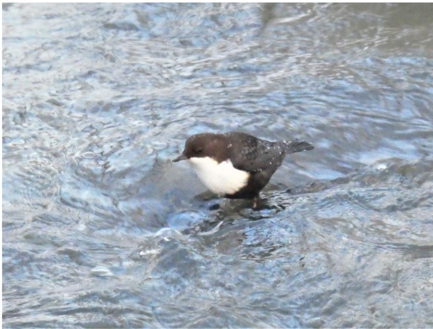
10.2 beundrade vi strömstare vid Esbo gård.