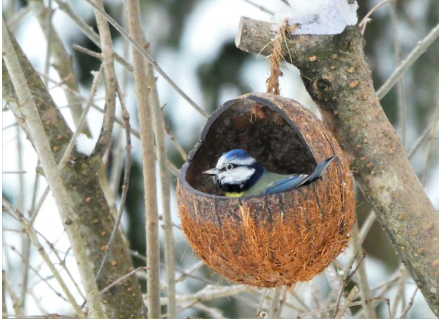
Blåmesen gillar skalade solrosfrön.