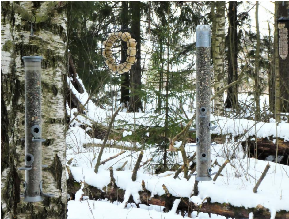
Dammen i Finnå har ett fint fågelmatningsställe som K-rauta bekostar. Här kan man i lugn och ro fota många fågelarter.