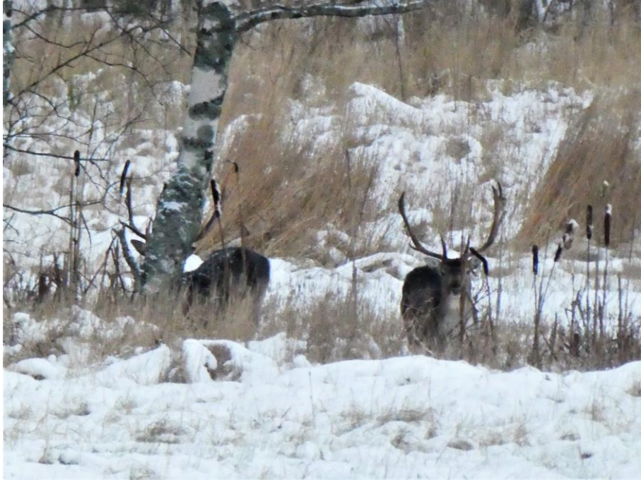
Dovhjortar kan man se på några ställen i Finland. Dessa 10.1. på Porkala udde.