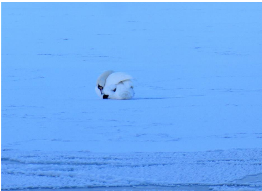
Ett svanpar med sina två ungar trotsar is och kyla utanför Drumsö 17.1.