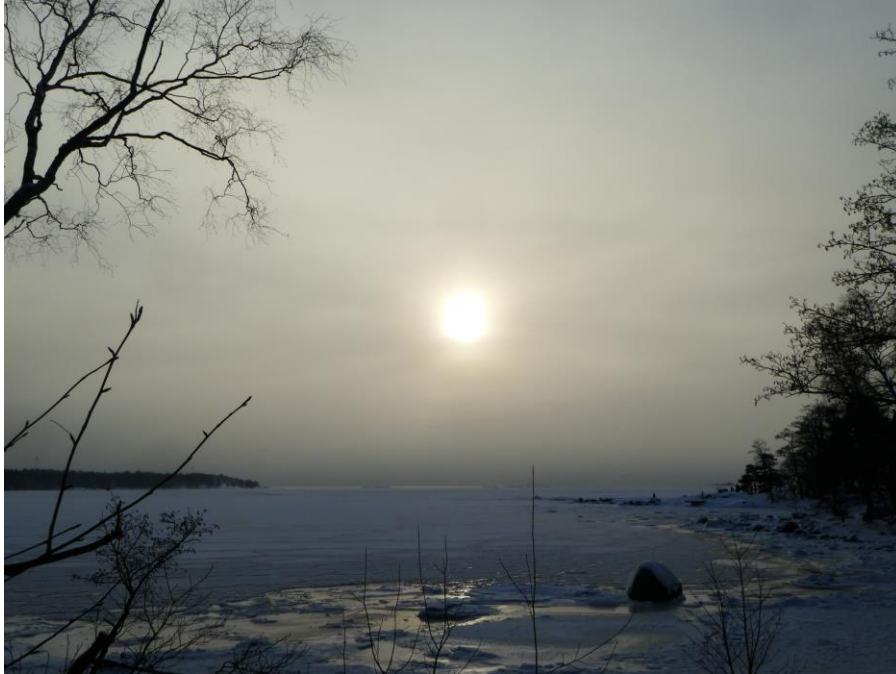
Sjörök och svag sol, Drumsö 17.1.